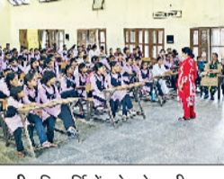
रेवाड़ी। विद्यार्थियों को स्टैम की जानकारी देती सुरवाइजर।