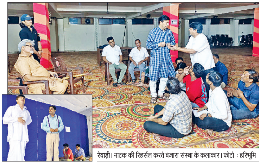
रेवाड़ी। नाटक की रिहर्सल करते बंजारा संस्था के कलाकार।