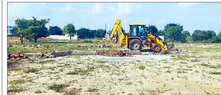
रेवाड़ी। अवैध कॉलोनी का निर्माण तोड़ती जेसीबी।