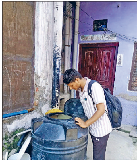
रेवाड़ी। पानी की टंकी में लार्वा की जांच करते हुए स्वास्थ्यकर्मी।

सितंबर माह में डेंगू के मामलों ने काफी रफ्तार पकड़ी हुई है। जिले के शहरी व ग्रामीण क्षेत्र में रोजाना लगातार डेंगू के मरीज मिल रहे हैं। शहरी क्षेत्र में फोंगिंग का कार्य नहीं होने के कारण मच्छरों का प्रकोप भी काफी बढ़ गया है। शुक्रवार को 6 डेंगू पॉजिटिव नए मरीज मिलने से संख्या 157 पर पहुंच गई है। स्वास्थ्य विभाग की ओर से डेंगू केस मिलने वाले स्थानों पर फोंगिंग कराई जा रही है तथा शहर के वाडों में फोंगिंग कार्य बिल्कुल भी नहीं किया जा रहा है। इसके अलावा गत दिवस वीरवार को मलेरिया का एक केस मिलने से अब तक 14 केस मिल चुके हैं। गत वर्ष 2024 सितंबर माह में 53, अक्टूबर में 173 व नवंबर माह में डेंगू के 154 मरीज मिलने से आंकड़ा 411 पर पहुंच गया था। अभी तक मिले डेंगू मरीजों में 133 की प्राइवेट व 24 मरीजों की सरकारी लेब से पुष्टि की गई है। जिला मलेरिया अधिकारी व डिप्टी सीएमओ डा. अमित यादव के मार्गदर्शन में हेल्थ इस्पेक्टर्स की टीम डेंगू की रोकथाम के लगातार प्रयास कर रही है। स्वास्थ्य विभाग की टीमों सोर्स रिडक्शन एक्टिविटी के दौरान घरों में लार्वा मिलने पर लोगों को नोटिस भी दे रही है। अब तक लार्वा मिलने पर 2301 से लोगों को नोटिस दिए जा चुके हैं। स्वास्थ्य विभाग की ब्रिंडिंग चकर टीम अब तक सोर्स रिडक्शन एक्टिविटी के तहत 1832129 घरों में लार्वा की जांच कर चुकी है।