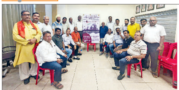
रेवाड़ी। बैठक में उपस्थित मोती चौक व्यापार संगठन के सदस्य।