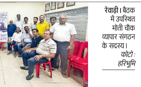
रेवाड़ी। बैठक में उपस्थित मोती चौक व्यापार संगठन के सदस्य।