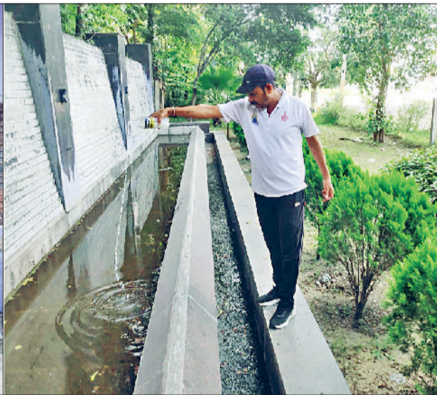
रेवाड़ी। पानी की खेल में दवा डालते स्वास्थ्यकर्मी।