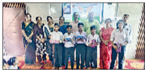
रेवाड़ी। विजेताओं को पुरस्कृत करते प्राचार्य व स्टाफ सदस्य।

राष्ट्रीय लोक अदालत में आमजन से संबंधित टेलीफोन, बैंक लोन से संबंधित केस तथा अन्य जरूरी सेवाओं से संबंधित केसों का निपटारा किया तथा 16 लाख 82520 रुपए का मुआवजा दिया गया। लोक अदालत में 862 मामले रखे गए, जिनमें से 540 मामलों का मौके पर ही निपटारा किया गया।