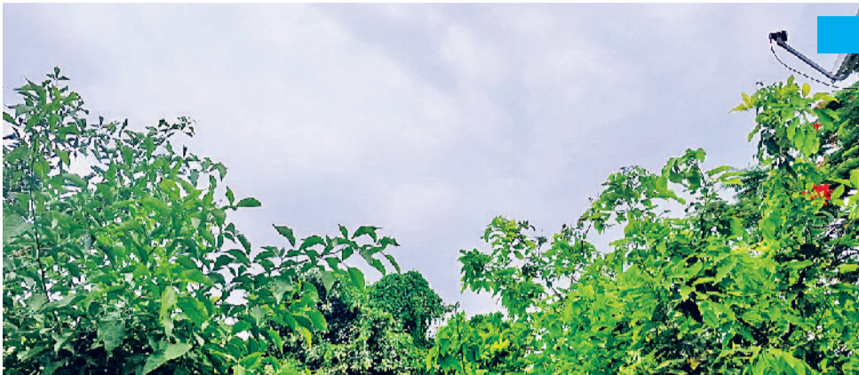
रेवाड़ी। शुक्रवार को मौसम साफ रहने से बढ़ने लगी गर्मी।

तेज धूप खिलने के कारण दिन का तापमान 0.8 डिग्री बढ़कर 35.0 डिग्री सेल्सियस पर पहुंच गया। न्यूनतम तापमान 0.5 डिग्री की कमी के साथ 20.0 डिग्री पर आ गया। हवा में नमी का स्तर 62 प्रतिशत रहा, जबकि गति 12 किमी प्रति घंटा रही। दोपहर बाद तक भारी गर्मी का प्रकोप बना रहा, जिससे कूलर और एसी एक बार फिर चलने शुरू हो गए।